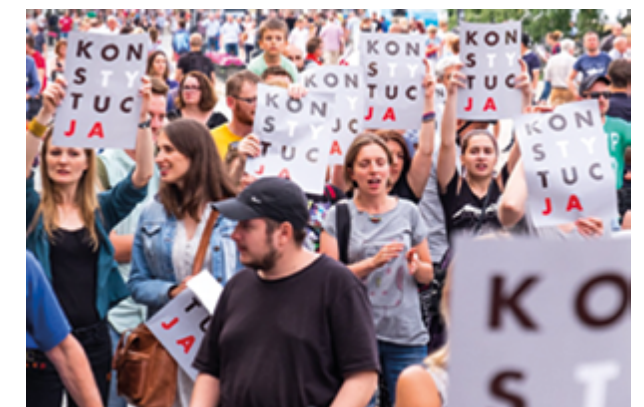
Voluntários manifestam-se pacificamente