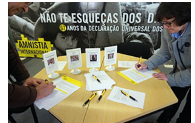
Voluntários recolhem assinaturas em petições (Amnistia Internacional)