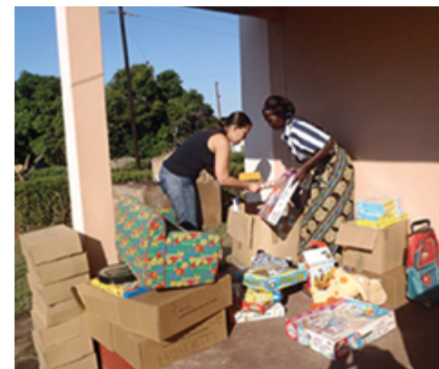
voluntários a distribuir bens em Moçambique (AIDGLOBAL)

➤ Ilustrar e complementar as sugestões apresentadas pelos alunos, projetando as seguintes imagens, que mostram ações de voluntários em diversas áreas: